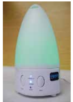
空間に散布する「ZAT」加湿器タイプ

それは銀、亜鉛、チタンというまったく違った成分が融合し、イオン化させた除菌・抗菌・消臭剤「ZAT」の存在です。