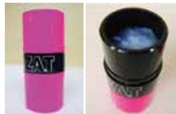
「ZAT」置型ゲルタイプ ゲルタイプは、自然気化式でゆっくり長く、広範囲に拡散されます。

日本での感染が外国と比べてまだゆるやかなのは、調和的、共生的な国民性だからかもしれません。